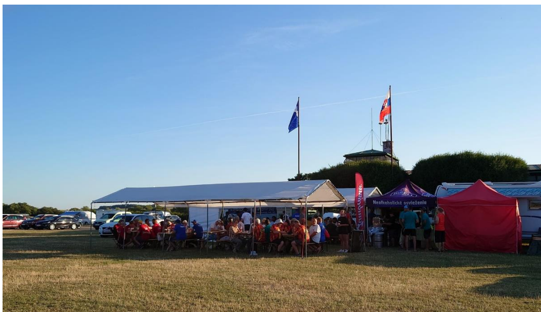
Gemütliches Beisammensein in der grossen F3K Familie