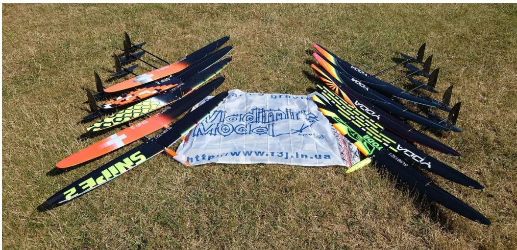
Viel Erfolg dem Vladimir-Team, aber auch alles Gute Vladimir.